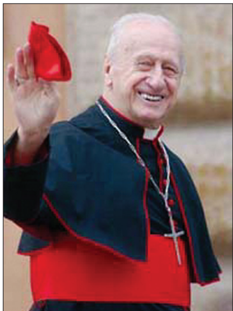
Card. Roger Etchegaray