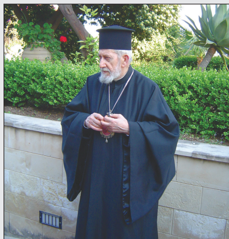
Sotir Ferrara eparca di Piana degli Albanesi