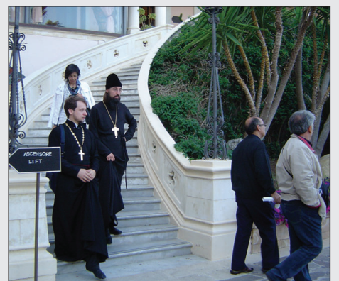
Tanti ortodossi a Siracusa