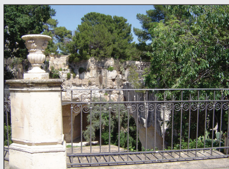
Le Latomie da Villa Politi