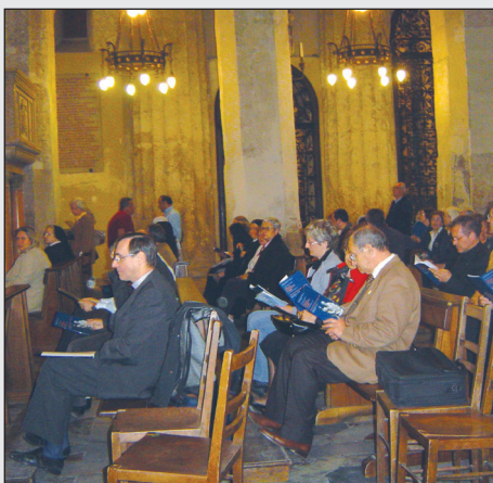
La preghiera nella cattedrale