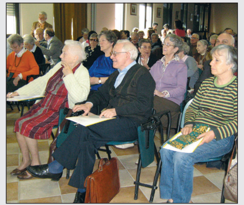
I soci del SAE a Pontenure