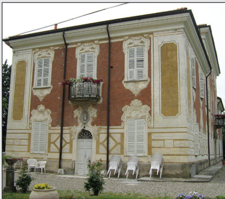
La sede del convegno