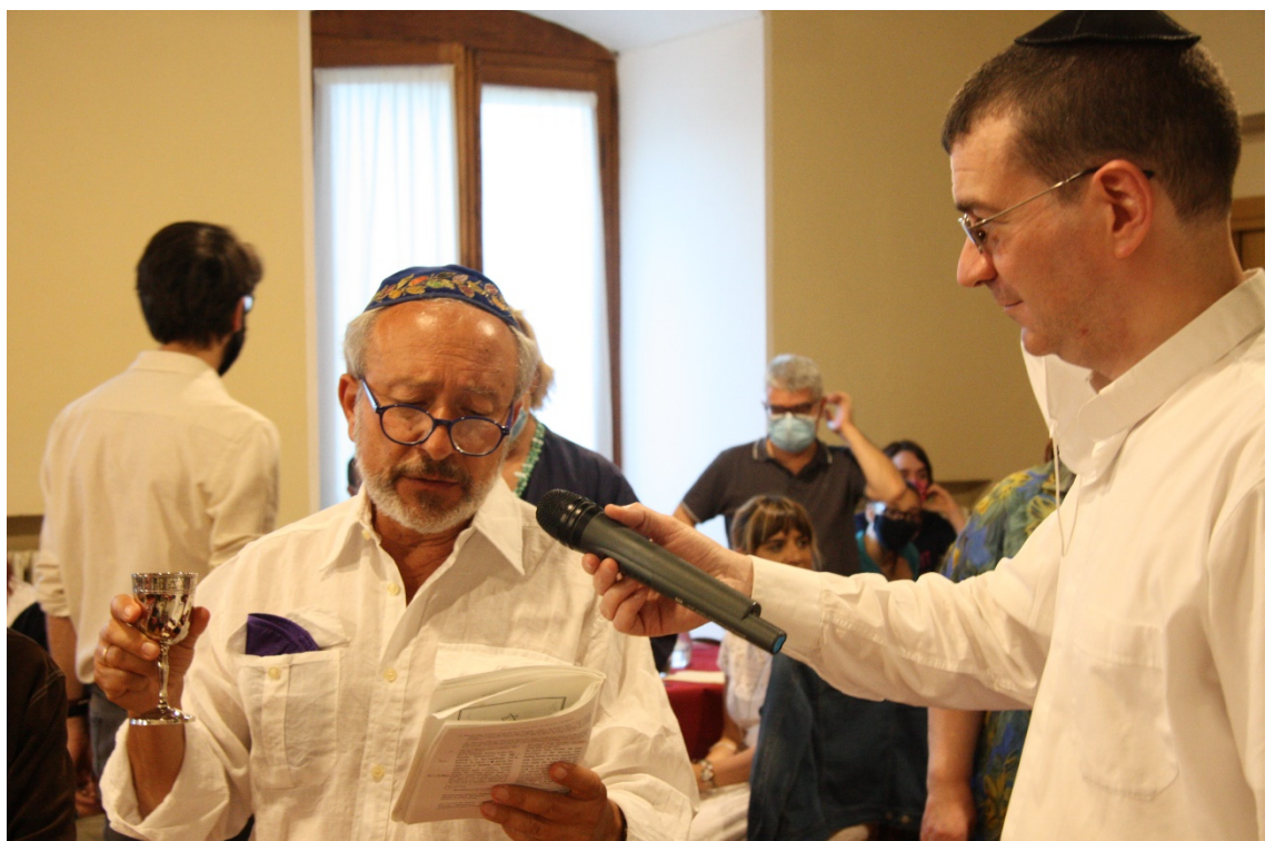
Ingresso dello Shabbat