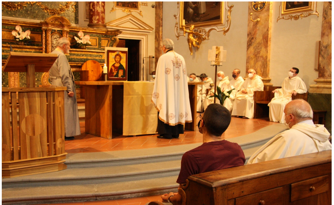
Il Vespro Ortodosso