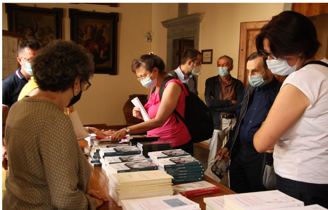
Il tavolo dei libri