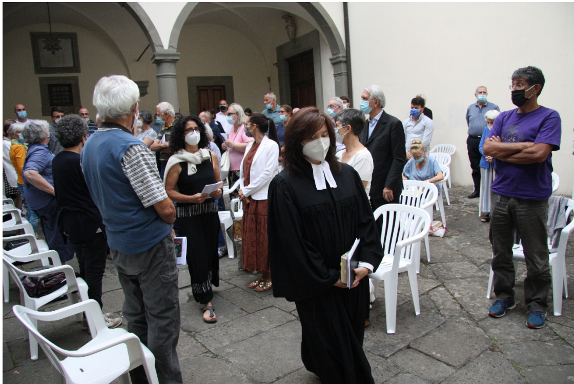
Culto di Santa Cena