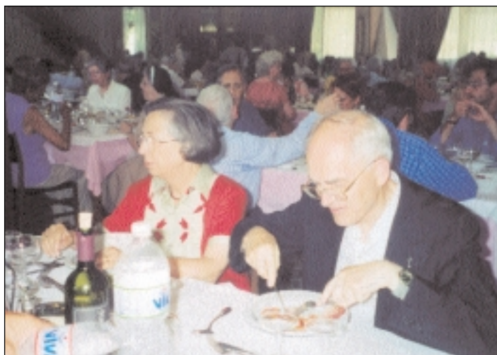
Un momento dell'incontro di Chianciano l'estate scorsa.

C'è, nella parola greca, ecumene un riferimento che il movimento ecumenico ha riscoperto sempre più negli ultimi anni: quello alla terra abitata, come casa ospitale per tutti coloro che vi vivono. Sempre più comprendiamo che l'unità delle chiese e l'incontro tra le diverse fedi trovano la pienezza del loro significato nel servizio alla pace ed al rinnovamento della comunità umana tutta, anzi, dell'intera comunità dei viventi. La giustizia, la pace e la salvaguardia del creato di Basilea, Seul e Graz indicano tre dimensioni imprescindibili per una convivenza possibile. È per questo che la Sessione di quest'anno è dedicata ad un tema che, ad un osservatore superficiale, potrebbe richiamare le parole d'ordine dei no-glo-