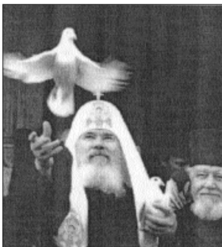
Il Patriarca Alessio II.

Anche oggi nessun dialogo sull'argomento delle diocesi, nessuna consultazione con la Chiesa locale prima della decisione presa: per la Chiesa Cattolica è chiaro che si tratta del suo problema interno. Invece per la Chiesa Ortodossa non è così. Per questo motivo, quando sente dire da parte della sua "Grande Sorella" dell'Occidente: «siamo amiche, siamo sorelle (o quasi), cerchiamo la comunione e la testimonianza comune davanti al mondo secolarizzato», la Chiesa Ortodossa dice: «no». Sembra