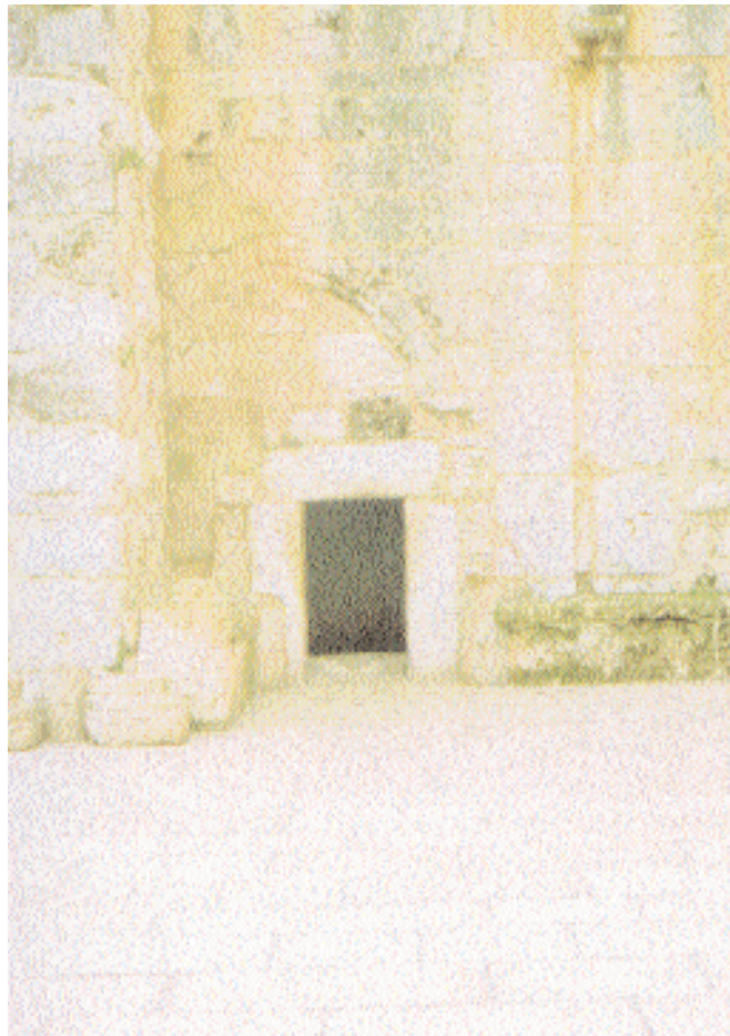
Betlemme - La porta della Natività.

In questo tempo drammatico , è importante mantenere aperti gli spazi per il dialogo tra ebrei e cristiani, come tra di essi ed i musulmani. È fondamentale ampliare ed approfondire tutte quelle forme di incontro che in questi anni hanno permesso, anche in Italia, il superamento di tante incomprensioni.