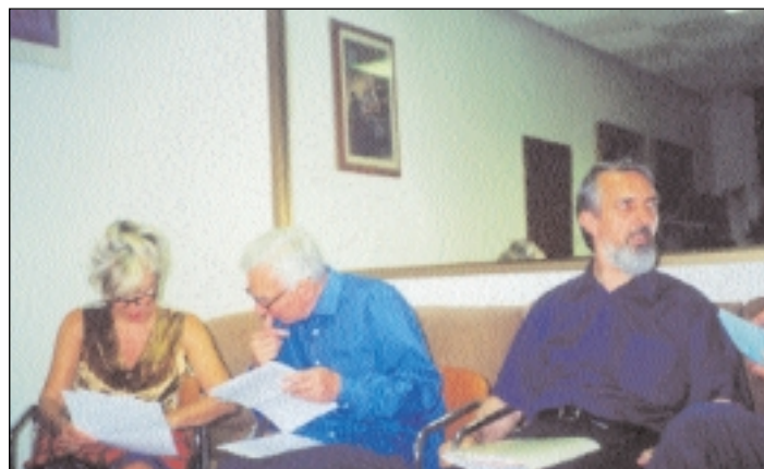
Un momento dell'incontro di Chianciano l'estate scorsa.

La delicata situazione internazionale – che sembra trovare un fragile punto focale nei conflitti che lacerano la terra di Israele – dice in forma chiara quanto