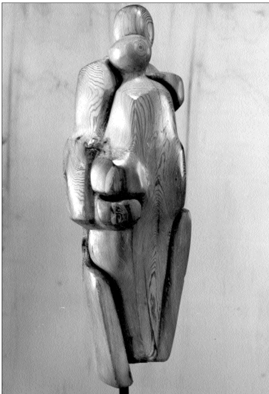
"Accoglienza" - scultura in legno di Sandro Leonardi.

Vorrei che l'incontro di Chianciano fosse un piccolo spazio dove si accoglie la sfida dell'utopia; dove si sogna, è vero, ma si condividono sogni per costruire la pace. Ogni piccolo passo, in questa direzione, vale la pena di essere compiuto.