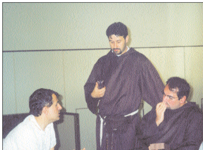
Un momento dell'incontro di Chianciano l'estate scorsa.