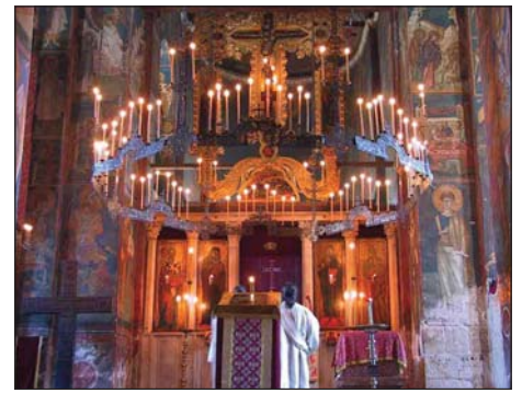
La parete di luce di un'iconostasi.