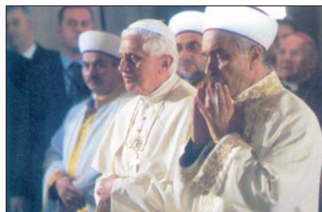
Benedetto XVI e il Mufti di Istanbul.

Il discorso del Papa a Ratisbona ha avuto larghe reazioni: davvero il dialogo ne è risultato più difficile? Larghissima eco ha avuto il viaggio di Benedetto XVI in Turchia. Quale di questi episodi ha avuto maggiori ripercussioni?