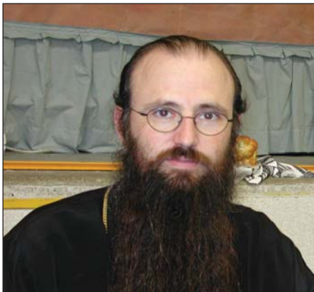
Il vescovo ortodosso Siluan Span.

Per tutto questo, il CGL nell'ottobre scorso aveva suggerito di dedicare il prossimo Convegno di Primavera all'approfondimento della spiritualità ortodossa. Ed è proprio quello che si farà a Rimini in un Convegno di breve durata (da venerdì 23 a domenica 25 marzo) del quale l'intera giornata di sabato 24 marzo sarà dedicata alla conoscenza della spiritualità ortodossa e la mattina della domenica 25 marzo all'assemblea dei soci, un appuntamento importante per un'associazione che vuole impostare la propria attività in modo democratico e fraterno ed affidare ai soci la scelta delle linee gui-