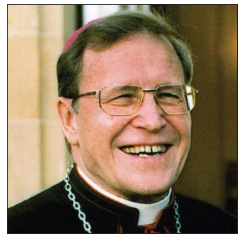
Il Cardinale Walter Kasper.

Kasper chiude affermando che l'ecumenismo è soprattutto un compito spirituale che al di là di tutte le divisioni «lascia spazio allo Spirito di Cristo, che è uno spirito di riconciliazione e di carità» ( ibid. p. 737). Per l'unità Gesù non ha indicato una strada, ma ha pronunciato una preghiera rivolta al Padre, per questo sappiamo che la preghiera è fondamentale e siamo certi che sarà esaudita. Anche qui l'invito a trovare tempi e modi di preghiera comune va rivolto a tutti i cristiani, in particolare il Sae potrebbe promuovere con maggiore impegno occasioni di riflessione e di preghiera.